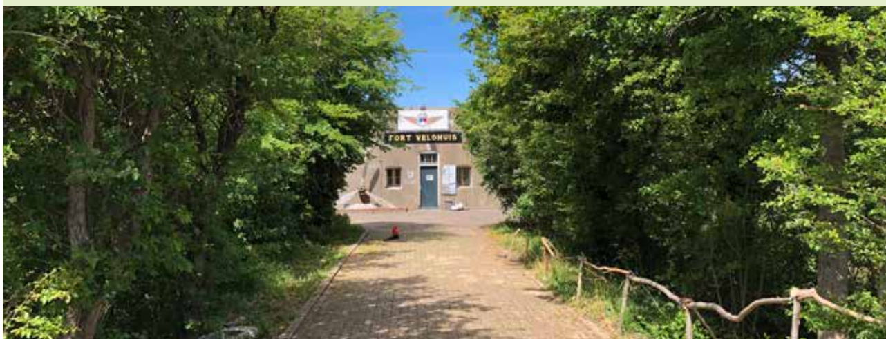
Fort Veldhuis aan de Genieweg in Heemskerk, een van de 45 forten van de Stelling van Amsterdam

De forten van het militaire erfgoed zijn goed bewaard gebleven. Een groot deel ervan heeft een nieuwe functie gekregen en is gerestaureerd en opgeknapt. De herkenbaarheid van de structuur en het militaire systeem in het landschap is echter door ontwikkelingen in en rond de Stelling steeds verder onder druk komen te staan. Het inundatiegebied is goeddeels door infrastructuur van de A9 en door woonwijken verloren gegaan; het resterende deel is voor de "leesbaarheid" van dit unieke landschap des te waardevoller.