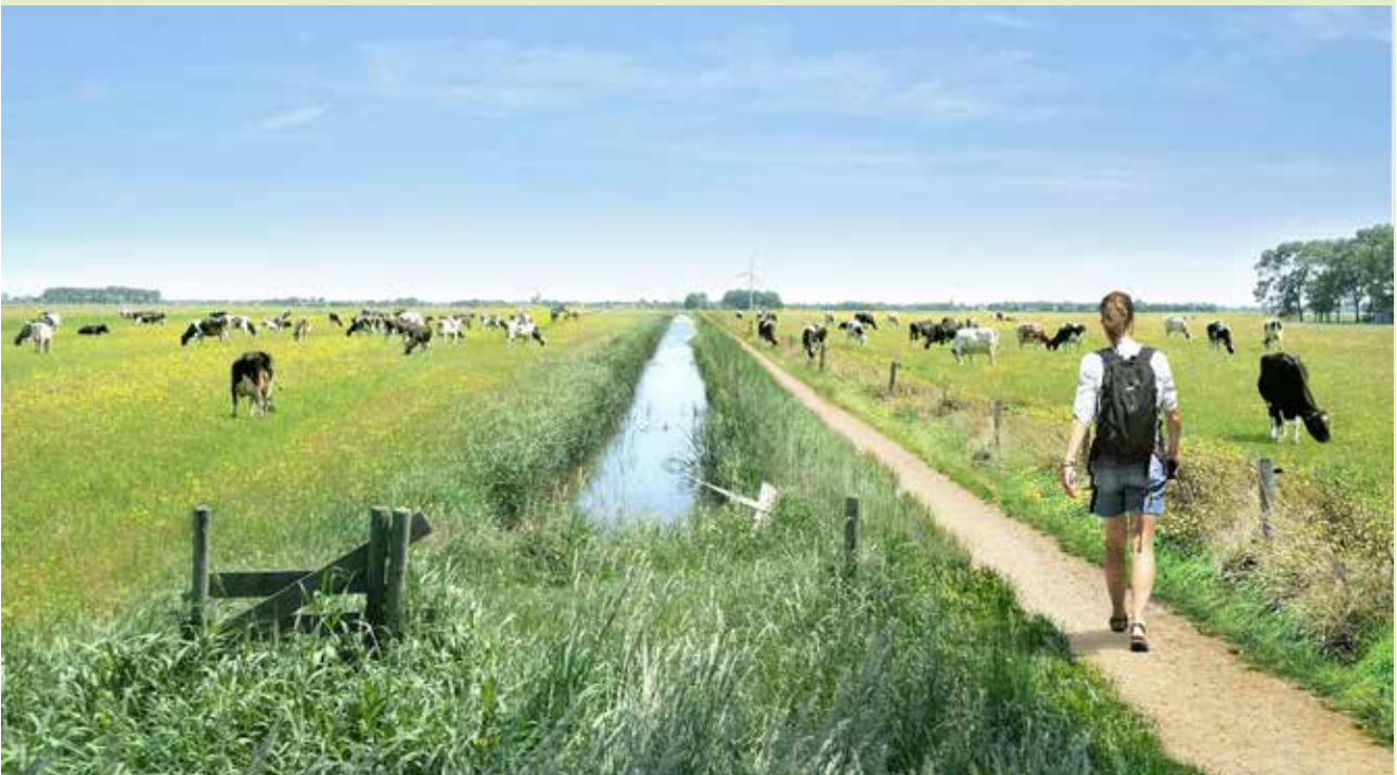
Visualisatie van het recreatief toegankelijk maken van het agrarisch landschap met boerenlandpaden.

Het Landschap van de boeren is een plan van de agrarisch ondernemers in de regio Assendelft-Uitgeest, Heemskerk en Beverwijk opgesteld o.l.v. Vereniging Agrarisch Natuur- en Landschapsbeheer Water, Land & Dijken, in opdracht van LTO. (26 oktober 2020).