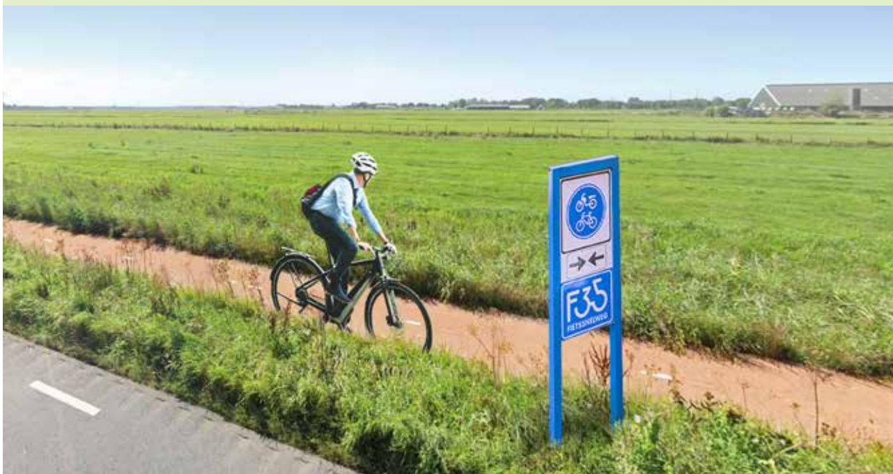
Visualisatie. Ruim baan voor de elektrische fiets.

De voorgestelde oplossingen voor een duurzaam mobiliteitsalternatief zijn afkomstig uit het rapport: "Alternatief mobiliteitsplan Verbindingsweg A8 en A9" opgesteld door Vereniging Rover en Vereniging Fietsersbond (nog te publiceren).