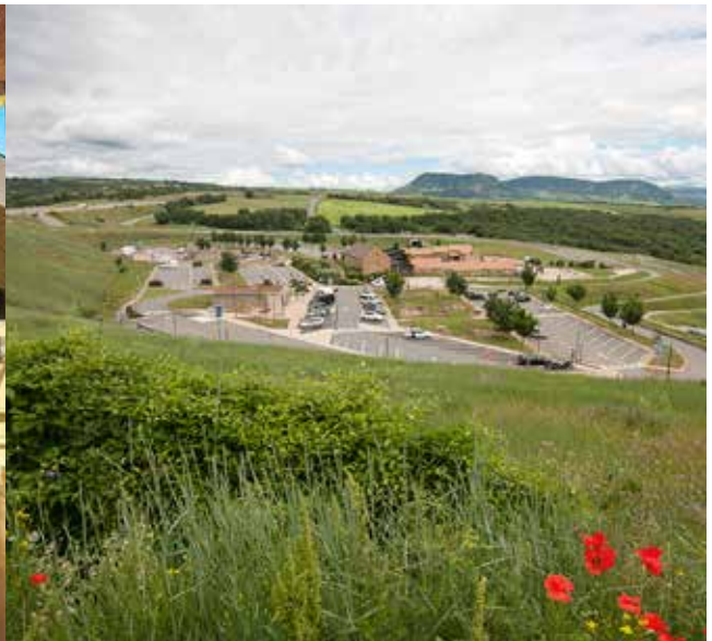
Onder: De Lepelaar en de Aalscholver aan de A6