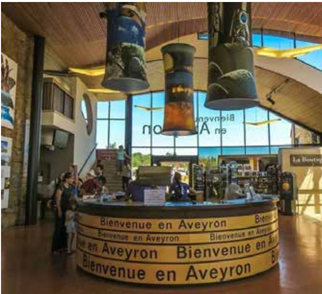
Boven: Millau in Aveyron